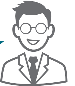
Pak Budi R&D Staff

Silahkan, Pak Ohm. Di sini ada Titrando generasi kedua serta sample preparation seri 800 yang dikendalikan oleh Tiamo™