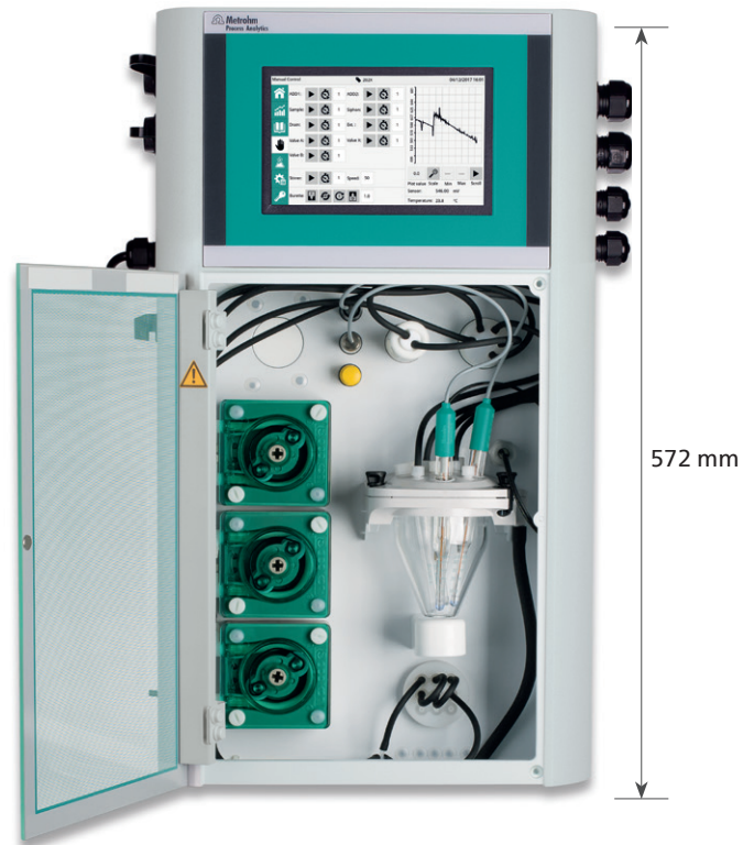
2026 Ammoniak Analyser

Weitere Informationen auf unserer Website: www.metrohm.de