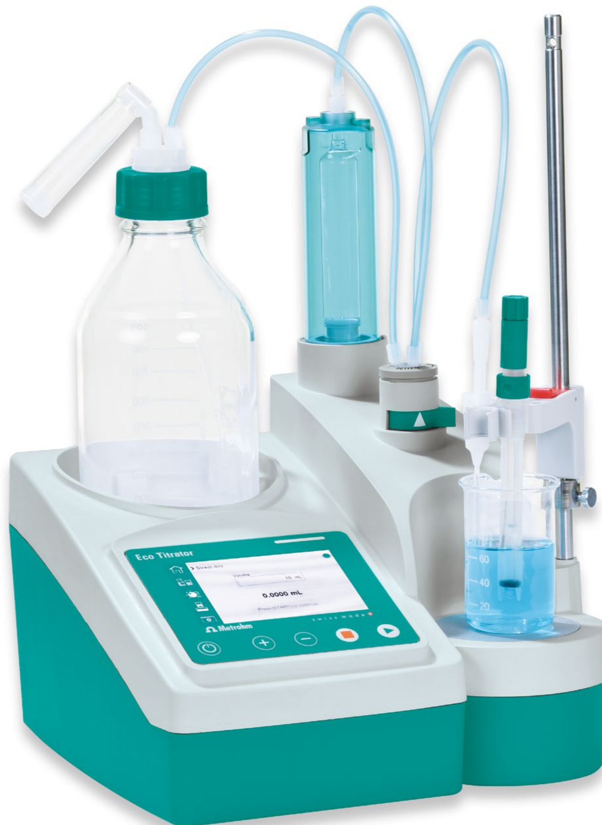
28.6 cm (长) x 28.6 cm (宽) x 22.0 cm (高)

使用 Eco 自动电位滴定仪工作就变得再简单不过了：按几个键，您就能得到一个准确的、可重复的样品结果。