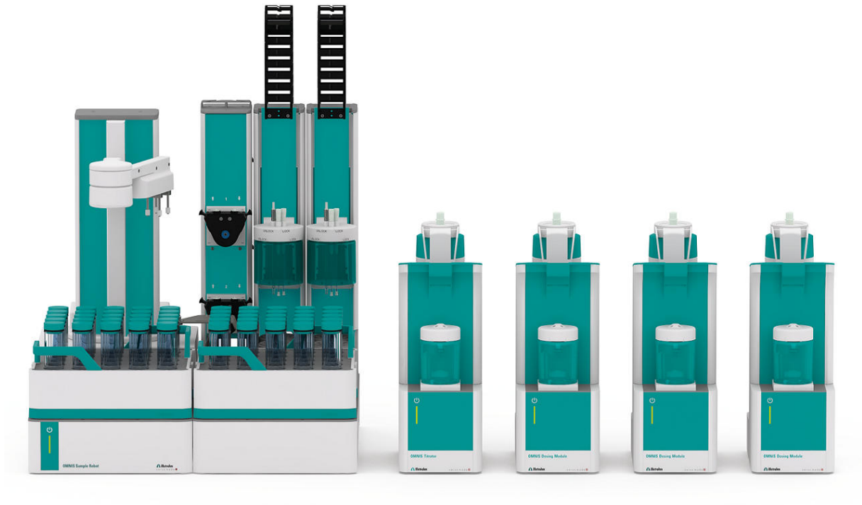
Abbildung 1. OMNIS Robot S mit Discover (Probenabdeckung) und paralleler Analyse.

OMNIS automatisiert den gesamten Analyseprozess mit: