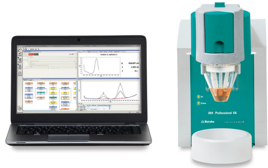
Abbildung 1. 884 Professional VA.

Probe und Grundelektrolyt werden in das Messgefäß zugegeben. Die voltammetrische Bestimmung von Blei wird am 884 Professional VA an der Multi-Mode-Elektrode pro als Arbeitselektrode unter Verwendung der in Tabelle 1 aufgeführten Parameter durchgeführt. Die Blei-Konzentration wird durch zweimalige Zugabe einer Pb-Standardlösung bestimmt.