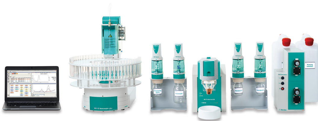
Abbildung 2. 884 Professional VA, vollautomatisiert für voltammetrische Analysen