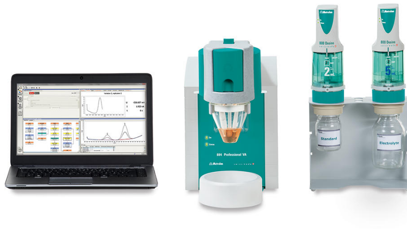
Abbildung 2. 884 Professional VA, halbautomatisiert für voltammetrische Analysen