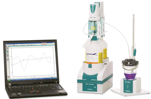
Abbildung 1. 859 Titrotherm-Setup für die thermometrische Titration und die mit tiamo durchgeführte Datenauswertung.

Festdünger genau in einen Messkolben eingewogen und in warmem Wasser aufgelöst.