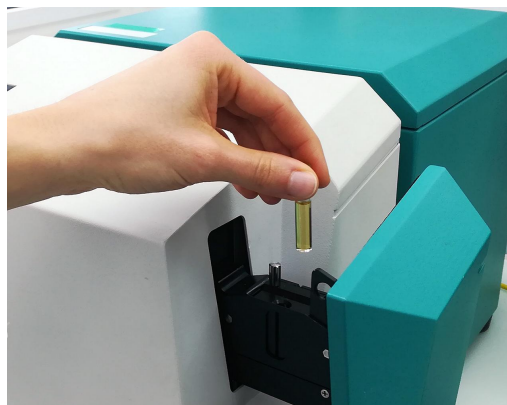
Abbildung 1. XDS RapidLiquid Analyzer und einer Isocyanatprobe, die sich in einem 8 mm Einwegfläschchen befindet.

Isocyanatproben wurden mit einem XDS RapidLiquid Analyzer im Transmissionsmodus über den gesamten Wellenlängenbereich (400-2500 nm) gemessen. Eine reproduzierbare Spektrenaufnahme wurde durch die eingebaute Temperaturkontrolle (bei 30 °C) des XDS RapidLiquid Analyzers erreicht. Zur Vereinfachung wurden Einweggefäße mit einer Schichtdicke von 8 mm verwendet, was die Reinigung der Probengefäße überflüssig machte. Das Metrohm-Softwarepaket Vision Air Complete wurde für die gesamte Datenerfassung und die Entwicklung von Vorhersagemodellen verwendet.