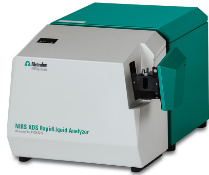
Abbildung 1. Der NIRS XDS RapidLiquid Analyzer mit einer 1 mm Quarzküvette, die zur Erfassung der Spektren von Tensidproben verwendet wird.

Insgesamt 37 Proben mit unterschiedlichem Tensidgehalt wurden von einem Kunden zur Verfügung gestellt. Die Vis-NIR-Spektren ( Abbildung 2 ) wurden mit einem Metrohm NIRS XDS RapidLiquid Analyzer aufgenommen, der mit einer 1-mm-Quarzküvette ausgestattet ist ( Abbildung 1 ). Die Proben wurden im Ist-Zustand ohne jegliche Probenvorbereitung gemessen. Die Datenerfassung und die Modellentwicklung erfolgten mit dem Softwarepaket Vision Air.