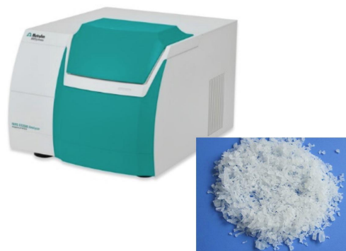
Figure 1. The DS2500 Solid Analyzer was used to collect the spectra of PVA polymer.

54 spectra from 18 different sample batches were collected using a Metrohm DS2500 Solid Analyzer in combination with the Vision Air Complete spectroscopy software. To overcome sample inhomogeneity, the measurement was performed with a large sample cup in rotation. The reference values were obtained by titration. Outlier detection was performed on pre-processed spectra (2 nd derivative) using a maximum distance in wavelength space algorithm. The NIRS prediction model was created with the settings described in the following table, and validated using cross validation.