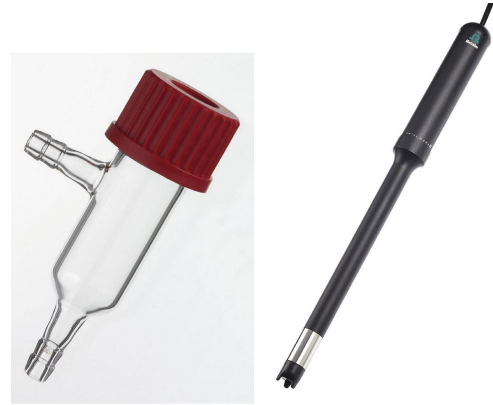
Figure 1. Used flow-through cell (left) and O 2 -Lumitrode (right).

The sensor is inserted and fixed into a flow-through cell, where the inlet is connected to the outlet of the water supply.