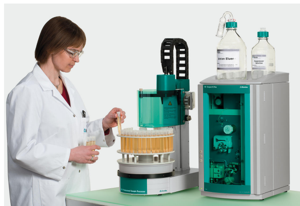
Abbildung 1. Kompaktes, benutzerfreundliches Metrohm IC-Gerät zur Quantifizierung von Oxohalogeniden neben Standardanionen in Trinkwasser.

Die analysierten Leitungswässer enthielten hohe Konzentrationen (d.h. im mg/L-Bereich) an Chlorid (13 mg/L), Sulfat (4 mg/L) und Nitrat (8 mg/L) ( Tabelle 1 und Abbildung 2 ). Bromid und Fluorid wurden in geringen Konzentrationen (<0,06 mg/L) nachgewiesen, während die toxischen Desinfektionsnebenprodukte Chlorat, Bromat und Chlorit sowie Nitrit nicht nachgewiesen werden konnten. Die Peakauflösungen von >1,5 zeigen, dass die Anionen basisliniengetrennt sind (Beispiel in Abbildung 2 ). Das Surrogat DCA wurde in keinem der Leitungswässer nachgewiesen, konnte aber vom höher konzentrierten Nitrat (30 mg/L) im Mischstandard mit einer Auflösung von 1,2 getrennt werden ( Abbildung 2 ). Die relativen Standardabweichungen (RSDs) für wiederholte Leitungswasseranalysen liegen unter 2,5 % ( Tabelle 1 , mit Ausnahmen für Chlorit und Bromat) und die Wiederfindungsraten der Spikes von 82-120 % entsprechen den allgemeinen Qualitätskriterien. Diese Ergebnisse beweisen die Reproduzierbarkeit , Genauigkeit und Robustheit der Methode. Die ermittelten Nachweisgrenzen (NG) (nach DIN 62645)