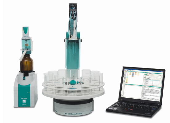
Abbildung 1. 814 Sample Processor und 905 Titrando, ausgestattet mit einer iAg-Titrode mit \text{Ag}_2\text{S} -Beschichtung, gesteuert durch die tiamo-Software.

Einer angemessenen Probenmenge werden 5 mL Salpetersäure zugesetzt, um die Probe anzusäuern. Dann wird deionisiertes Wasser zugegeben, um die Glasmembran und den Silberring der Elektrode zu bedecken, und die Probe wird mit standardisierter Silbernitrat-Lösung bis nach dem Äquivalenzpunkt titriert.