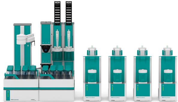
Abbildung 1. Der OMNIS Sample Robot S ist ausgestattet mit einem OMNIS Professional Titrator, einer entsprechenden Anzahl von OMNIS Dosiermodulen zur Zugabe aller notwendigen Lösungen und einer dPt-Titrode zur automatischen Bestimmung der Iodzahl.

Eine Probenvorbereitung ist nicht erforderlich.