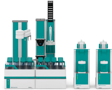
Abbildung 1. Sample Robot S mit Dis-Cover-Funktionalität, Dosiermodul und OMNIS Advanced Titrator mit dPt-Titrode zur Bestimmung der Peroxidzahl in Speiseölen.

Zu einer angemessenen Menge der Probe werden automatisch sowohl ein Lösungsmittelgemisch (essigsäurehaltig) als auch eine Hilfslösung (gesättigte Kaliumiodidlösung) zugegeben. Die resultierende Lösung wird eine Minute lang gerührt, um die Reaktion abzuschließen. Anschließend wird deionisiertes Wasser zugegeben und die Probe mit standardisiertem Natriumthiosulfat bis zum Erreichen des Äquivalenzpunktes titriert.