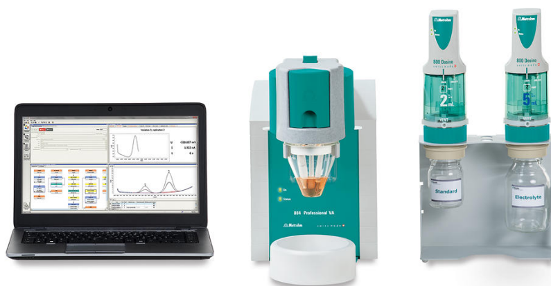
Figure 2. 884 Professional VA, semiautomated for VA analysis