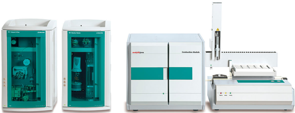
Abbildung 1. Combustion-IC-Setup bestehend aus einem 930 Compact IC flex (2.930.2560), einem 920 Absorber Module (2.920.0010), einem Combustion Module (Oven + ABD, 2.136.0700) und einem für feste Proben konfigurierten MMS 5000 Autosampler (2.136.0800) (6.7302.000).

anderen Halogenen und Schwefel) in das 920 Absorber Module überführt und in der wässrigen Phase absorbiert. Das präzise, automatisierte Liquid Handling erfolgt mit Dosinos, um die wässrige Probe zur Analyse in den IC (930 Compact IC flex) zu überführen. Um den Hintergrund und die Nachweisgrenzen von Fluor niedrig zu halten, ist es wichtig, chemische Reagenzien zu verwenden, die mindestens den Reinheitsgrad "zur Analyse" (p.a.) aufweisen.