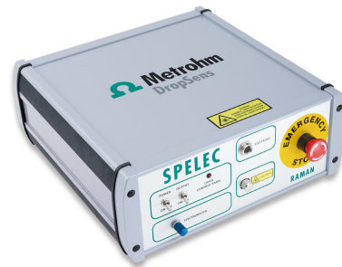
Abbildung 2. Das SPELEC-RAMAN, das für die Messungen in der Application Note verwendet wurde.