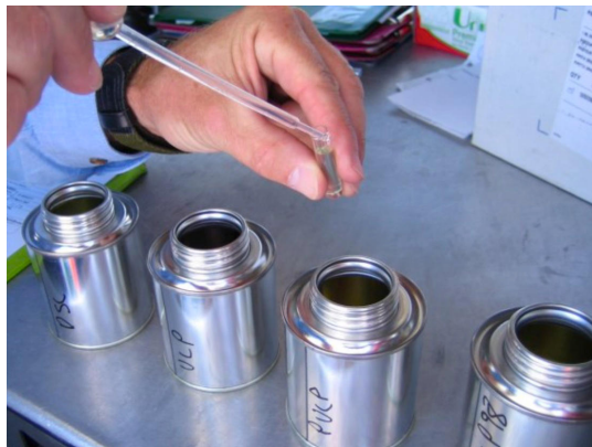
Abbildung 1. Die Proben werden in Einweggefäße mit einer Pfadlänge von 8 mm gefüllt.

99 Pygasproben wurden mit einem NIRS XDS RapidLiquid Analyzer analysiert, der mit 8 mm Einweg-Glasfläschchen ausgestattet ist. Alle Messungen wurden im Transmissionsmodus von 400 nm bis 2500 nm durchgeführt. Die Temperaturregelung war auf 40 °C eingestellt, um eine stabile Probenumgebung zu gewährleisten. Aus praktischen Gründen wurden Einweg-Glasfläschchen mit einer Schichtdicke von 8 mm verwendet, was ein Reinigungsverfahren überflüssig machte. Das Metrohm-Softwarepaket Vision Air Complete wurde für die Datenerfassung und die Entwicklung von Vorhersagemodellen verwendet.