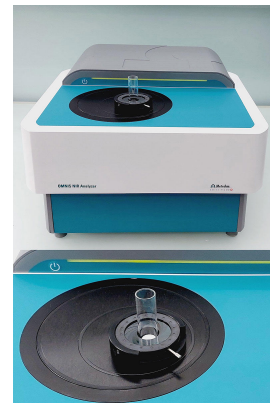
Abbildung 1. OMNIS NIR Analyzer Solid mit 15 mm Küvette und flexiblem Halter OMNIS NIR.

Die Referenzwerte wurden gemäß der USP<922> Wasseraktivität [3] gemessen.