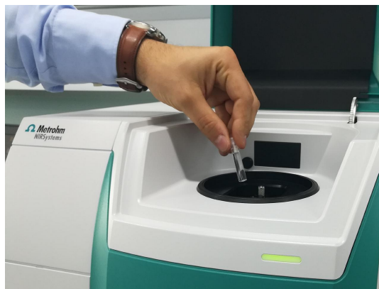
Abbildung 1. DS2500-Flüssigkeitsanalysator und eine in ein Einwegfläschchen gefüllte Probe.

17 Proben von drei verschiedenen CBD-Trägerölen (Hanf-, Fisch- und MCT-Öl (mittelkettige Triglyceride)) wurden im Transmissionsmodus mit einem DS2500 Liquid Analyzer gemessen. Die eingebaute Temperaturkontrolle wurde auf 40 °C eingestellt, um reproduzierbare Spektren zu erhalten. Der Einfachheit halber wurden Einweggefäße mit einer Schichtdicke von 8 mm verwendet, was die Reinigung der Probengefäße überflüssig machte. Das Metrohm-Softwarepaket Vision Air Complete wurde für die gesamte Datenerfassung und die Entwicklung von Vorhersagemodellen verwendet.