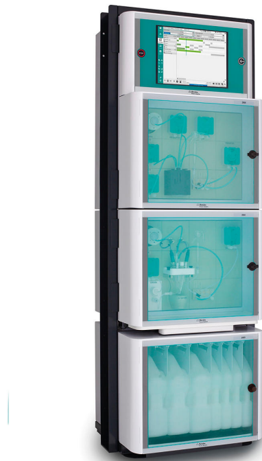
Abbildung 2. 2060 TI Process Analyzer für die Online-Analyse von kritischen Qualitätsparametern in Beizbädern.

Metrohm Process Analytics bietet einen Multiparameter-Prozessanalysator, der sich für die gleichzeitige Analyse von \text{Fe}^{2+}/\text{Fe}^{3+} und dem Verhältnis von freier Säure zu Gesamtsäure über einen weiten Konzentrationsbereich eignet - den 2060 TI Process Analyzer (Abbildung 2).