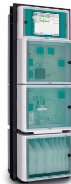
Abbildung 2. 2060 Process Analyzer von Metrohm zur Online-Überwachung des Wasserstoffperoxids während des CMP-Prozesses.

Die Online-Überwachung von Wasserstoffperoxid, pH-Wert, Leitfähigkeit und Temperatur ist mit dem 2060 Process Analyzer von Metrohm Process Analytics möglich. Die Wasserstoffperoxidkonzentration wird titrimetrisch mit Cer(IV) unter Verwendung einer Pt-Ringelektrode gemessen, um den Endpunkt mit dynamischer Endpunkttitration (DET) zu bestimmen. Die Analysenhäufigkeit beträgt typischerweise weniger als 5 Minuten und gewährleistet eine zeitnahe Kontrolle der Slurry. Die Kombination von verschiedenen Analysemethoden und die Bestimmung der Parameter aus verschiedenen Prozessströmen kann über das gesamte Produktportfolio der Metrohm-Prozessanalytik realisiert werden. Alle Plattformen garantieren schnelle, genaue und kontinuierlich verfügbare Ergebnisse für eine echte Prozesskontrolle.