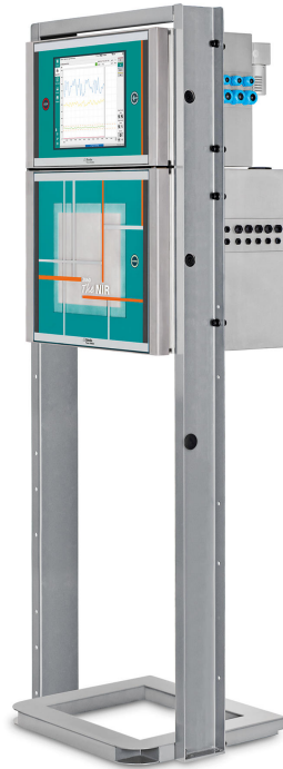
Abbildung 3. 2060 The NIR Analyzer von Metrohm Process Analytics.