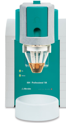
Abbildung 1. 884 Professional VA, manuelles Messsystem unter Verwendung der MME pro

Die Probe und die Elektrolytlösung werden in das Messgefäß zugeben und für 5 min entgast. Der störende Einfluss von Chlorid wird durch die Zugabe eines Maskierungsmittel abgeschwächt. Die Bestimmung von Thioharnstoff erfolgt mit dem 884 Professional VA (Abbildung 1) unter Verwendung der in Tabelle 1 angegebenen Parameter. Die Konzentration wird durch zweimalige Zugabe einer Thioharnstoff-Standardlösung ermittelt.