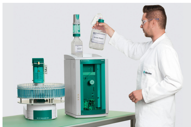
Figure 1. Instrumentación IC de Metrohm compacta y fácil de usar para cuantificar diversos aniones en explosivos y residuos de explosiones.

Supresión secuencial, incluidos productos químicos y CO 2 -supresión, reduce la conductividad de fondo a alrededor de 1 µS/cm y mejora enormemente la relación señal-ruido. Todos los aniones se determinan con un detector de conductividad y se cuantifican con el software MagIC Net.