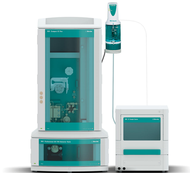
Figure 1. Configuración instrumental que incluye un 930 Compact IC Flex con un 947 Professional UV/VIS Detector Vario, un 800 Dosino para administración y mezcla de PCR y un 889 IC Sample Center: genial. El enfriamiento puede prolongar la estabilidad de la muestra.

Las muestras y las soluciones estándar se inyectaron directamente en el IC ( Figura 1 ) usando un 889 IC Sample Center – genial. El zinc se separa de todos los demás cationes utilizando material de columna L91 (Metrosep A Supp 10 - 250/4.0 y Metrosep A Supp 10 Guard/4.0) aplicando el eluyente MetPac™ PDCA (ácido piridina-2,6-dicarboxílico) (concentrado dilución 1: 5) seguido de una reacción post-columna (PCR) con MetPac™ PAR y posterior detección a una longitud de onda de 530 nm.