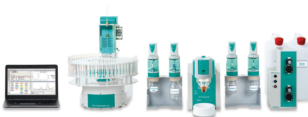
Figure 2. 884 Professional VA completamente automatizado para VA