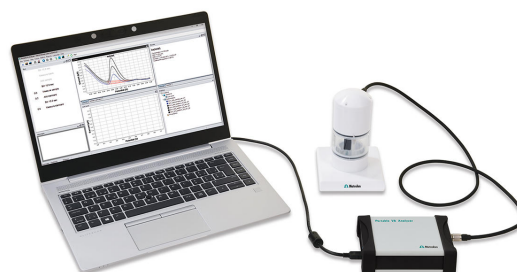
Figure 1. Analizador VA portátil 946 (versión scTRACE Gold)

El scTRACE Gold se activa electroquímicamente antes de la primera determinación. En el siguiente paso, la muestra de agua y el electrolito de apoyo se pipetea en el recipiente de medición. La determinación se lleva a cabo con el 884 Professional VA o con el 946 Portable VA Analyzer utilizando los parámetros especificados en tabla 1 . La concentración se determina mediante dos adiciones de una solución de adición estándar.