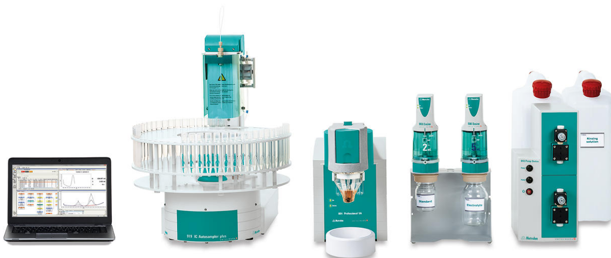
Figure 1. 884 Professional VA, completamente automatizado para el análisis de AV

pipetea en el recipiente de medición. La determinación de cromo(VI) se realiza con el 884 Professional VA utilizando los parámetros especificados en tabla 1 . La concentración se determina mediante dos adiciones de una solución estándar de adición de cromo (VI).