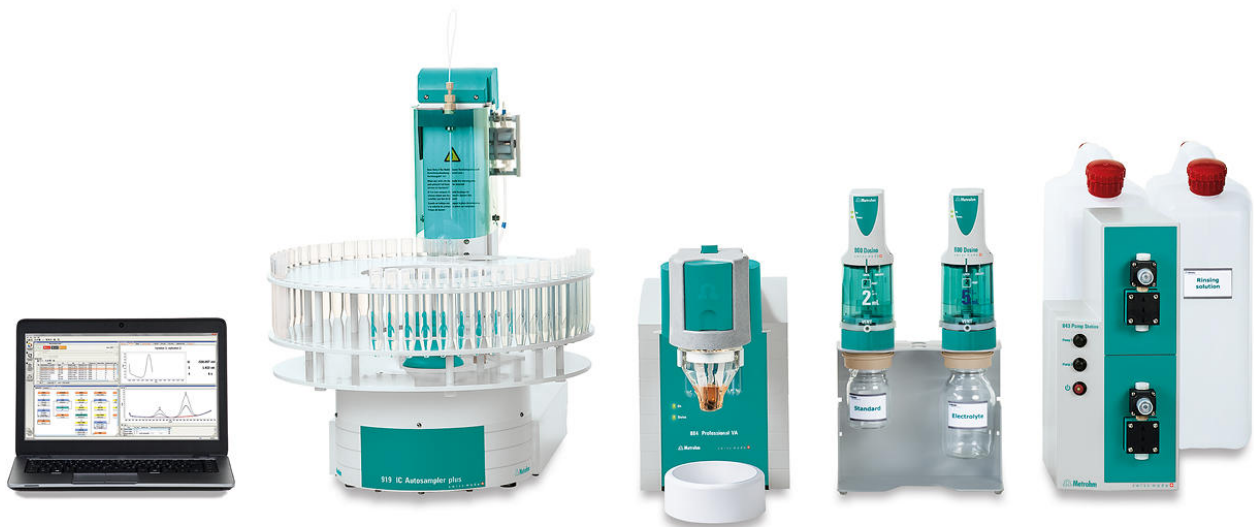
Figure 2. 884 Professional VA, completamente automatizado para el análisis de AV