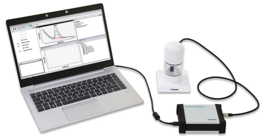
Figure 1. Analizador de AV portátil 946

El scTRACE Gold se activa electroquímicamente antes de la primera determinación.