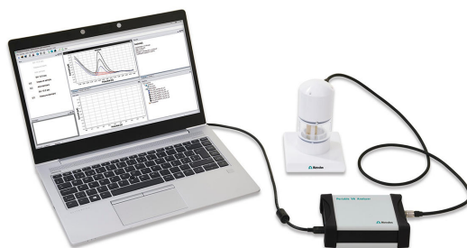
Figure 1. Analizador portátil de AV 946 (SPE)

Antes de la primera determinación, la película de mercurio ex situ se deposita en un paso separado sobre el electrodo serigrafiado. La muestra de agua y el electrolito de apoyo se pipetea en el recipiente de medición. La determinación simultánea de cadmio y plomo se realiza con el 884 Professional VA o con el 946 Portable VA Analyzer utilizando los parámetros especificados en tabla 1 . La concentración de ambos elementos se determina mediante dos adiciones de una solución estándar de adición de cadmio y plomo.