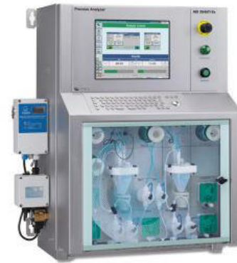
Figure 2. ADI 2045TI Ex proof (ATEX) Analyzer.

El cloruro se analiza con detección de conductividad como se describe en ASTM D3230 con el analizador a prueba de explosiones ADI 2045TI (Figura 2).