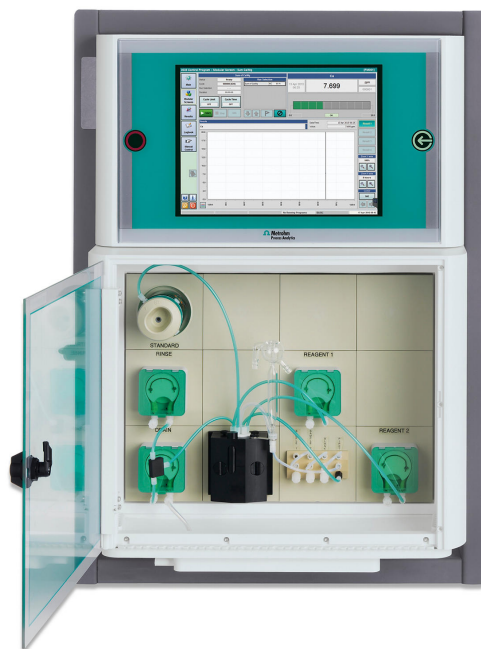
Figure 4. 2035 Analizador Fotométrico.