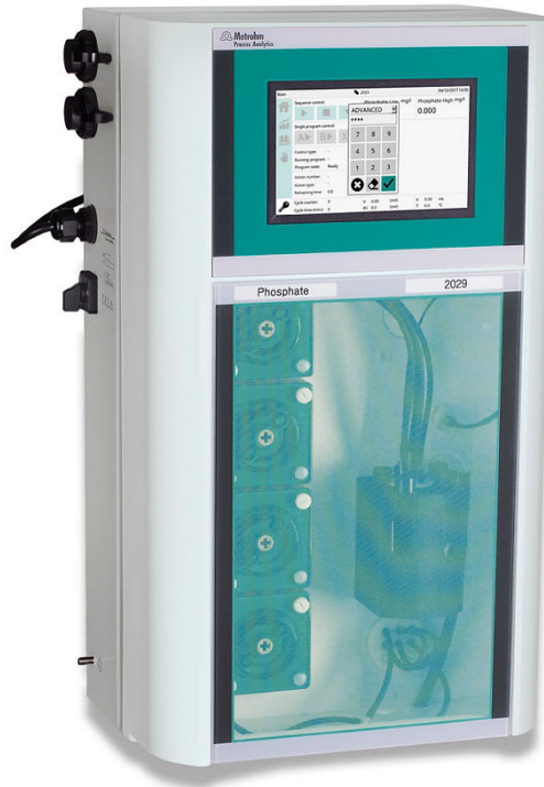
Figure 2. 2029 Fotómetro de proceso.