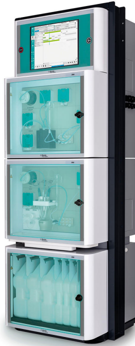
Figure 3. Analizador de procesos 2060 TI.