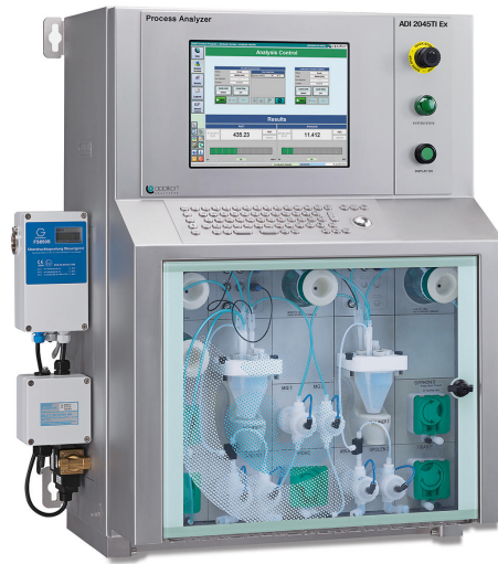
Figure 2. El analizador de procesos a prueba de explosiones 2045TI está certificado para áreas de Zona 1 y Zona 2.