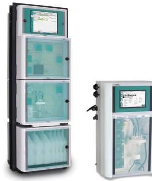
Figure 3. Algunos de los analizadores de Metrohm Process Analytics capaces de determinar la concentración de amoníaco en línea. Izquierda: 2060 Process Analyzer, derecha: 2026 Titrolyzer.