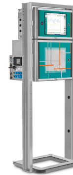
Figure 3. 2060 The NIR-Ex Analyzer de Metrohm Process Analytics.

Cada analizador NIR-Ex 2060 de Metrohm Process Analytics está configurado para aplicaciones en zonas ATEX. Estos instrumentos son capaces de monitorizar hasta cinco puntos de proceso por armario NIR con la opción de multiplexor.