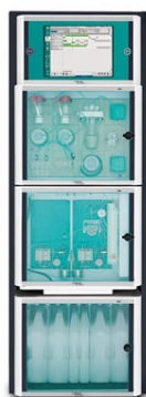
Figure 3. El analizador de procesos IC 2060 está disponible con uno o dos canales de medición, junto con módulos de manejo de líquidos integrados y varias opciones de preparación de muestras automatizadas.