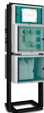
Figure 3. Analizador de procesos 2060 VA de Metrohm Process Analytics.

Al emplear determinación voltamétrica, el analizador de procesos VA 2060 (figura 3) funciona de forma totalmente automática. También cuenta con un sistema de alarma que notifica al personal de la planta cuando alguno de los metales pesados monitoreados se acerca a los valores límite. Esta alerta oportuna permite la introducción de la regeneración del intercambiador de iones u otras estrategias de mitigación, evitando eficazmente el incumplimiento de los valores límite.