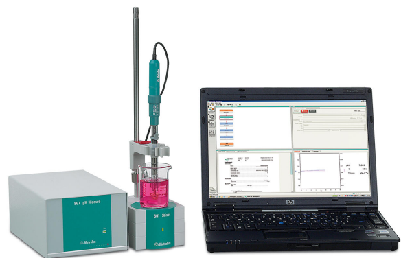
Figure 1. Módulo de pH 867 para una medición de iones precisa y fiable.

sulfuro es altamente volátil, debe conservarse en condiciones alcalinas utilizando acetato de zinc.