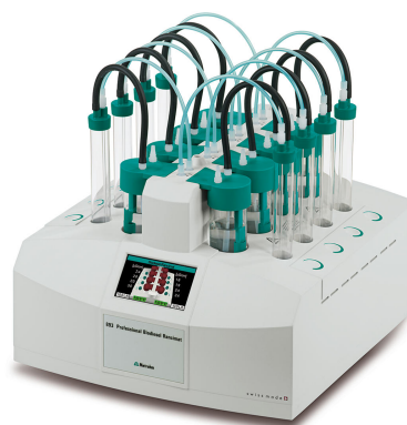
Figure 1. 893 Biodiesel Profesional Rancimat equipado con recipientes de medición y reacción para la determinación de la estabilidad a la oxidación del biodiesel.

agregaron 10 mg de palmitato de ascorbilo a 100 ml de biodiesel.