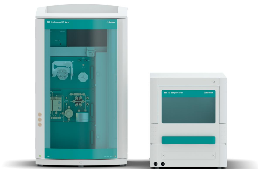
Figure 1. Configuración instrumental que incluye un 940 Professional IC Vario ONE/SeS/PP, un detector de conductividad IC (L) y el 889 IC Sample Center (R).