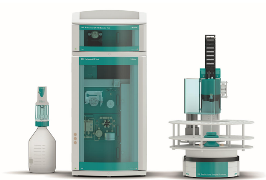
Figure 1. Configuración instrumental que incluye un 940 Professional IC Vario (centro), un 947 Professional UV/VIS Detector Vario SW (arriba, centro), un 858 Professional Sample Processor (derecha) y MiPCT-ME, realizado con el Metrosep A PCC 2 HC/4.0 y un Dosino (izquierda).

Después de la inyección, los componentes aniónicos se separaron isocráticamente en 45 minutos en un Metrosep A Supp 10 - columna 250/4.0 . La señal del detector UV/VIS se registró a 215 nm. La confirmación de la precisión del método se realizó con un estudio de adición. A la muestra se le añadió un estándar de nitrito a dos niveles de concentración (1,0 \mu\text{g/l} y 4 \mu\text{g/l} ) y se evaluaron los valores de recuperación.