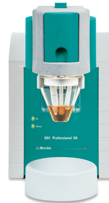
Figure 1. 884 Manual profesional VA para MME.

La muestra de lfp se pesa, se mezcla con ácido sulfúrico diluido desgasificado, se calienta a 85\text{ }^\circ\text{C} durante 15 minutos y luego se enfría. Luego, la solución de muestra digerida se agrega al recipiente de medición que contiene 20 ml de electrolito desgasificado. La cuantificación se realiza mediante dos adiciones estándar con soluciones separadas de Fe(II) y Fe(III).