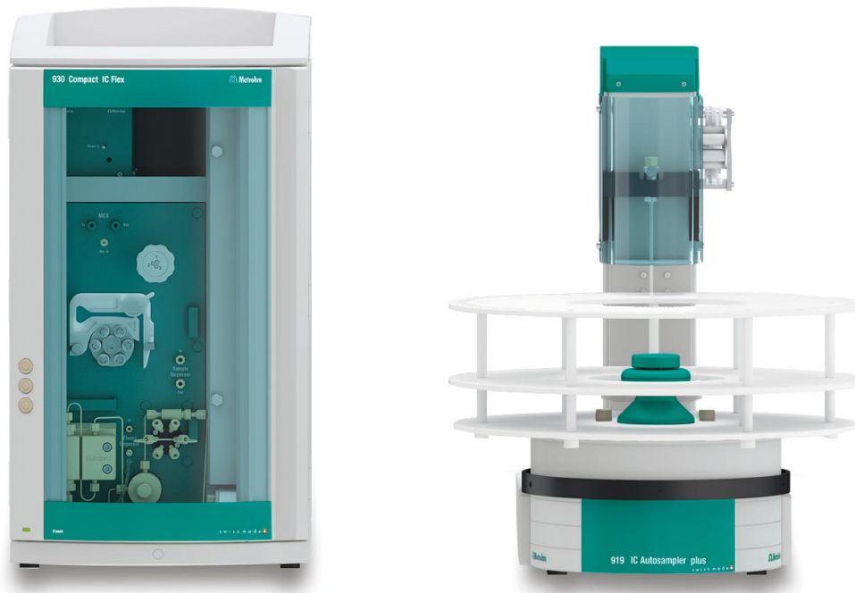
Figure 1. Configuración instrumental que incluye un 930 Compact IC Flex con IC Conductivity Detector MB (L) y el 919 IC Autosampler plus (R).

sales de sodio. Se utilizaron sales anhidras de diferentes fabricantes.