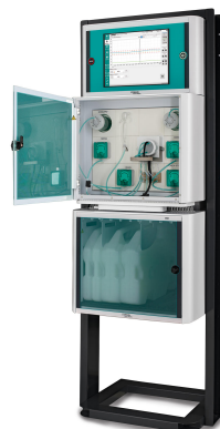
Figure 3. Analizador de procesos XRF 2060.

Los límites de detección para el análisis XRF están influenciados por varios factores, como el tiempo de análisis, la preparación de la muestra y los métodos de calibración. Gracias a su avanzado detector de deriva de silicio y al uso sinérgico de múltiples técnicas de análisis, el analizador de procesos XRF 2060 logra límites de detección bajos y precisos, particularmente para metales preciosos como el oro. La incorporación de ambas técnicas de análisis (es decir, titulación/fotometría y XRF) en el analizador de procesos XRF 2060 ofrece a los usuarios una solución integral para monitorear los niveles de cianuro y las concentraciones de metales en el proceso de recuperación de oro. Esta integración mejora la seguridad de la planta, garantiza la recuperación total de cianuro de soluciones complejas y acelera el retorno de la inversión (ROI) al consolidar ambos métodos en un solo analizador, lo que reduce la huella y los costos operativos.