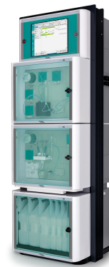
Figure 2. Analizador de procesos 2060 TI.

Al integrar analizadores de procesos en línea en la refinería, los operadores pueden verificar rápidamente los niveles de cianuro en el proceso de lixiviación y en el efluente de aguas residuales. Esto les ayuda a hacer correcciones para mejorar la eficiencia y reducir el daño al medio ambiente.