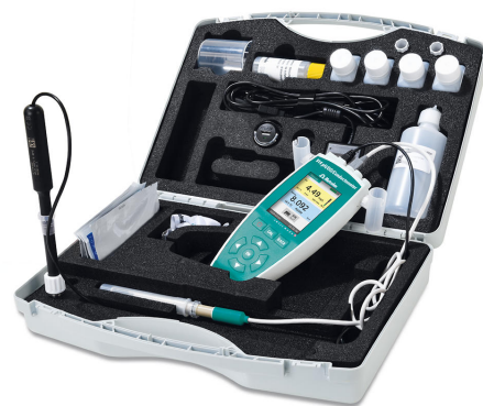
Figure 1. Maletín de transporte que incluye todos los accesorios y un conductómetro/pH/OD 914 equipado con un O 2 -Lumitrodo y un sensor de conductividad para la determinación del oxígeno disuelto en una corriente de agua dulce.

Ambos sensores se insertan directamente en la superficie del agua en el punto de interés, a una profundidad de al menos 3,5 cm.