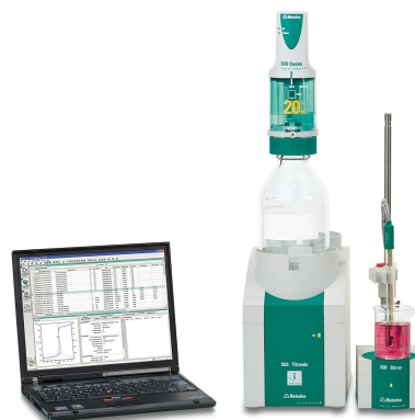
Figure 1. 907 Titrande con tiamo. Configuración ejemplar para la determinación fotométrica de la pureza del sulfato de zinc.

Se pesa una cantidad adecuada de muestra en un vaso de precipitados y se disuelve en agua desionizada. Luego se agrega al vaso de precipitados tampón de amoníaco pH 10 y una pequeña cantidad de indicador Eriochrome Black T. La muestra se titula fotométricamente con EDTA estandarizado hasta después del punto de ruptura.