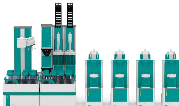
Figure 1. El robot de muestra OMNIS S está equipado con un titulador profesional OMNIS, más una cantidad correspondiente de módulos de dosificación OMNIS para agregar todas las soluciones necesarias y un titulador dPt para la determinación automatizada del valor de yodo.

Se pesa una cantidad adecuada de muestra en el vaso de valoración, luego se cubre el vaso con una tapa y se coloca en el soporte de muestras. Antes de la titulación, se agregan ácido acético glacial, solución de Wijs (ICI) y solución de acetato de magnesio y la solución se agita durante cinco minutos. Posteriormente se anade solución de yoduro de potasio y se titula la solución con tiosulfato de sodio estandarizado hasta después del punto de equivalencia.