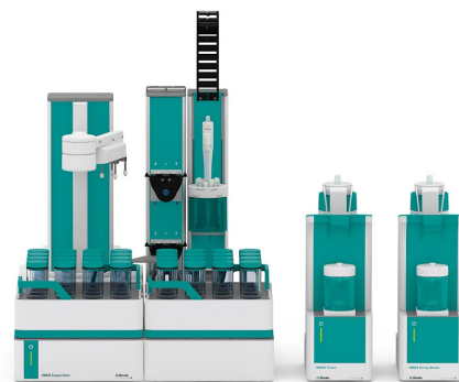
Figure 1. Robot de muestra S con funcionalidad Dis-Cover, módulo de dosificación y titulador avanzado OMNIS equipado con dPt Titrode para la determinación del valor de peróxido en aceites comestibles.

A una cantidad razonable de muestra, se añaden automáticamente una mezcla de disolventes (que contiene ácido acético) y una solución auxiliar (solución saturada de yoduro de potasio). Después, la solución resultante se agita durante un minuto para completar la reacción. Se añade agua desionizada y se titula la muestra con tiosulfato de sodio estandarizado hasta alcanzar el punto de equivalencia.